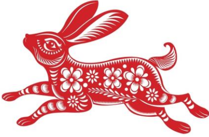
Χρονιά του Λαγού

Βρες το αποτύπωμα του 58 ου Θησαυρού στο Χρόνο.