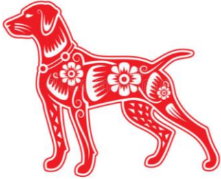
Χρονιά του Σκύλου